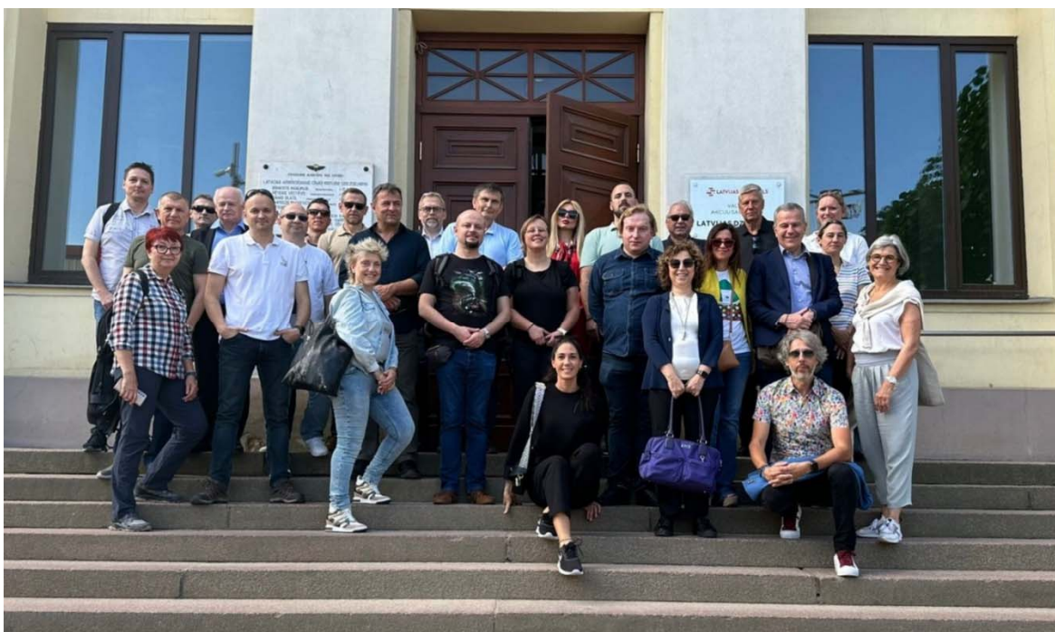
Чланови Генералне скупштине COLPOFER

Уследиле су потом презентације представника Европске комисије и UIC Безбедносне платформе, који су присутне упознали са најновијим активностима. У циљу сталног унапређења синергије и сарадње са UIC -ом, Одбор је предложио да се у Одбор COLPOFER-а укључи стални ревизор из UIC -а, који би могао бити идентификован или као директор Одељења за безбедност UIC -а, или као други виши службеник за безбедност кога ће изабрати UIC . Планирано је да на следећи састанак Одбора буду позвани и председавајући и потпредседник.