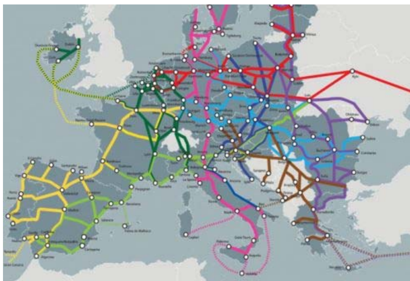
Мапа ТЕН-Т коридора

Европски парламент усвојио је измену Уредбе која подржава Трансевропску транспортну мрежу (TEN-T). Ревидирана Уредба укључује подстицаје за промовисање одрживих видова транспорта, унапређење дигитализације и побољшање мултимодалности комбиновањем различитих видова саобраћаја у једном путовању у оквиру јединственог европског тржишта. Такође, Уредба се бави изазовима климатских промена и војном мобилношћу на TEN-T мрежи.